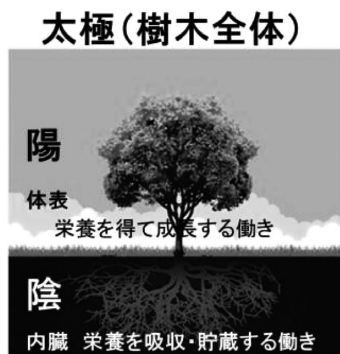
陰陽論＝陰陽、虚实、表裏、寒熱

漢方医学の素晴らしさは、陰陽太極論や陰陽五行説という古代東洋哲学を、人の健康と疾病に取り入れて、複雑系システム論として治療体系を築き、数千年にわたる治療実践によって、その効果を歴史的に検証してきたことにあると思う。